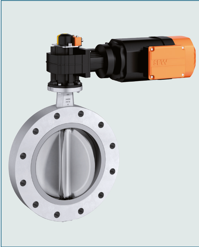
Flügel­schleuse zum Absperr­en oder Regeln von Schüttgut-Strömen.