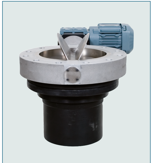
Flügel­schleuse in bevorzugter Einbaulage