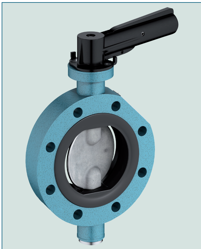
Przepustnica cysternowa typ TW 100 z manszetą z NBR.