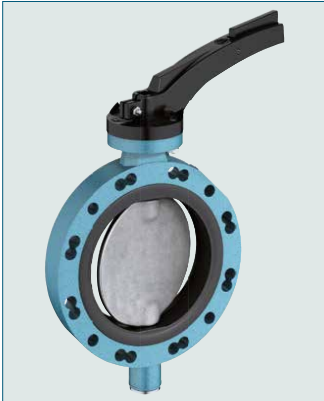
对夹式蝶阀TW150 配 NBR 阀座