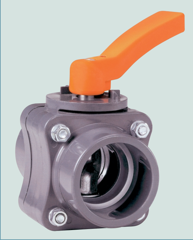
Açık-Kapalı kol kumandalı PVC kelebek vana K016