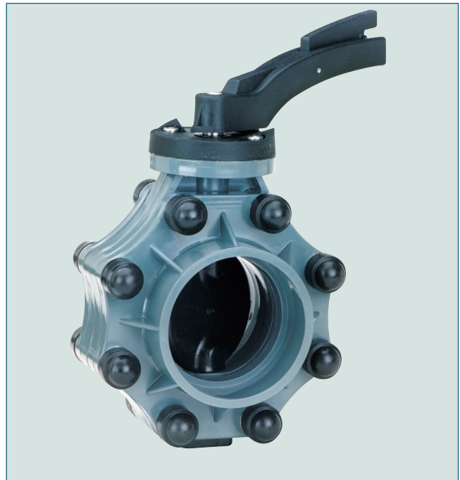
Kilitli kol kumandalı K016 kelebek vana