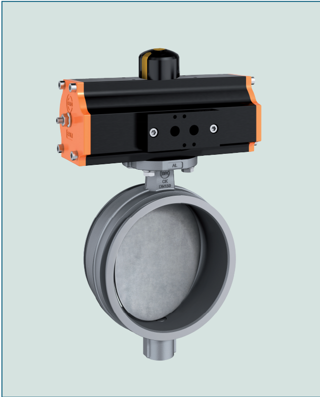
Rohrsystemklappe Typ CK-M mit pneumatischem Antrieb EB-SYD.