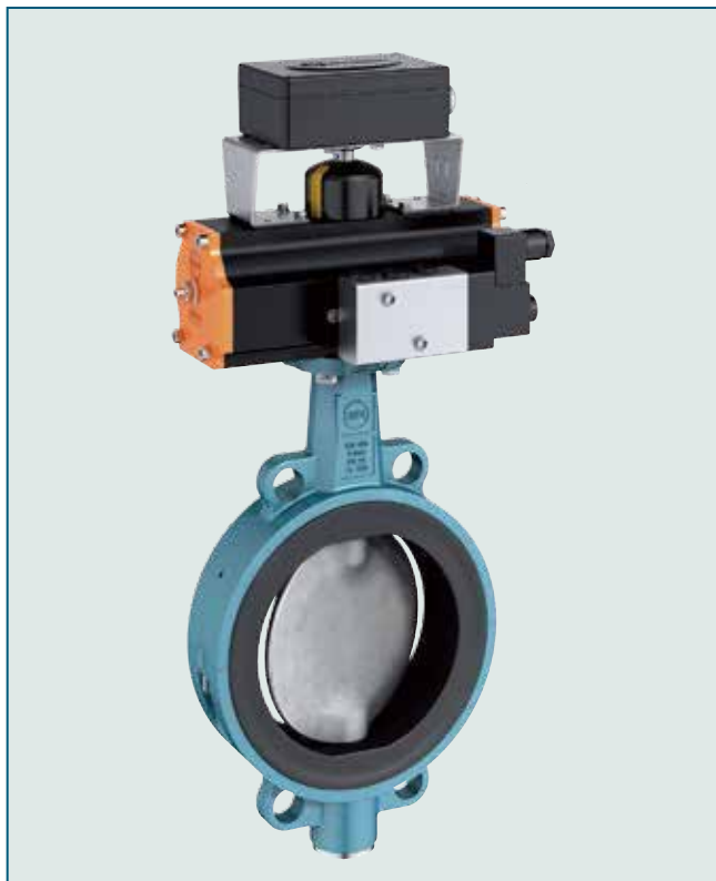
中线软密封蝶阀，适合中度腐蚀工况。