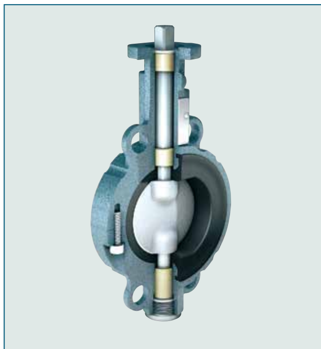
两片式阀体，使维护更加方便、快捷。