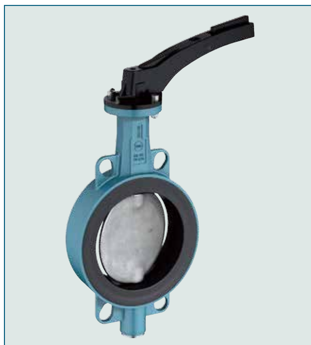
铝阀体口径: DN 50 - DN 400