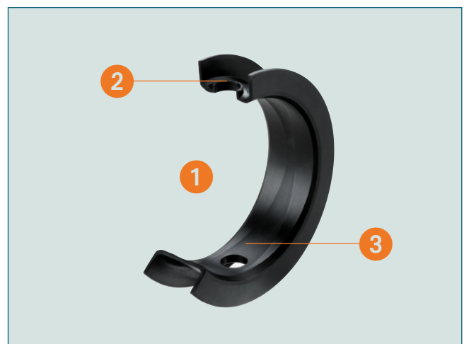
Abb. 2: Leitfähige PTFE-Manschette.